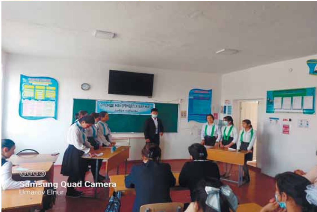
Samsung Quad Camera Umarov Elnur