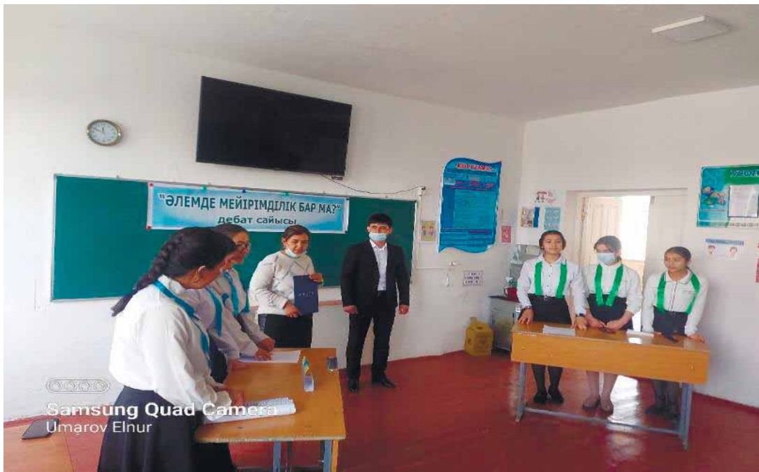
Samsung Quad Camera Umarov Elnur