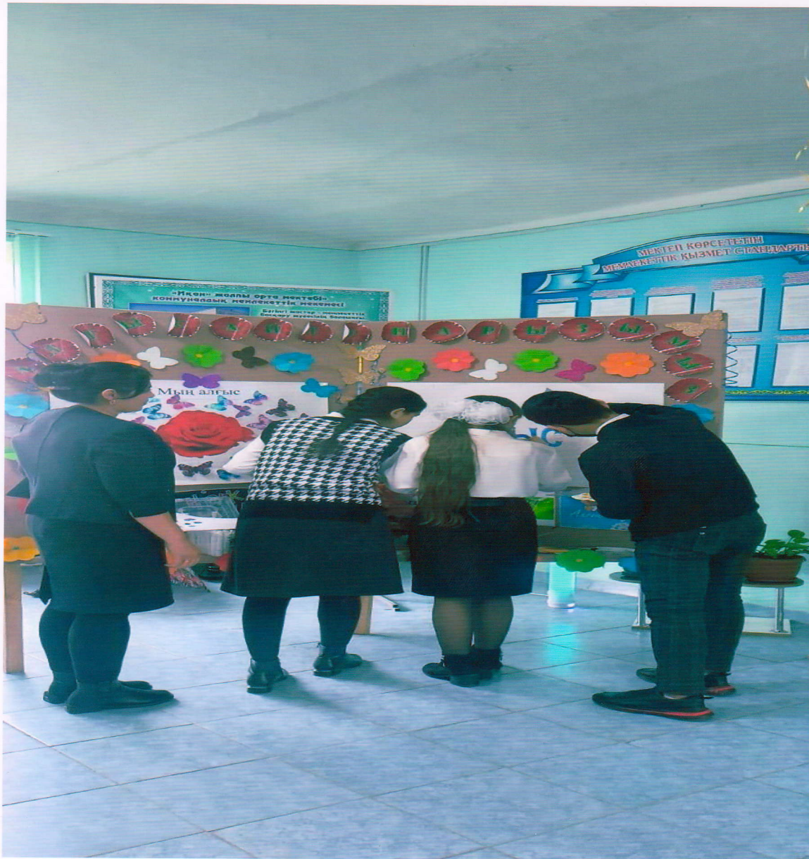
«Сен бақытты баласын» тақырыбында оқушылармен сұхбаттасу өткізілді.