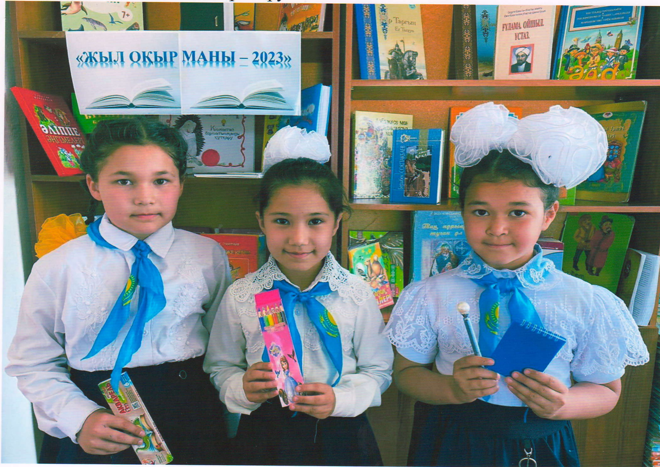
Дайындаған: Г. Абдуразакова

«Жыл оқырманы -2023» байқауы өткізілді. Мақсаты: Оқушыларды кітапханаға баулу, кітап оқуға деген ықласын арттыру.